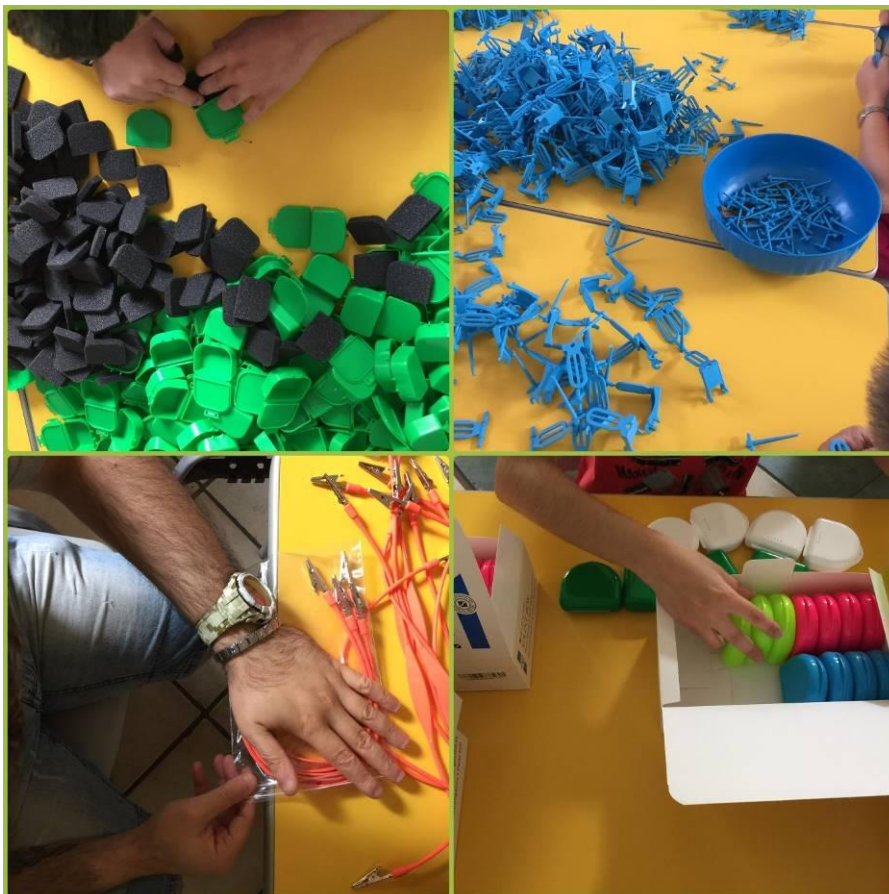
fig. 2e 3 laboratorio di inclusione socio lavorativa